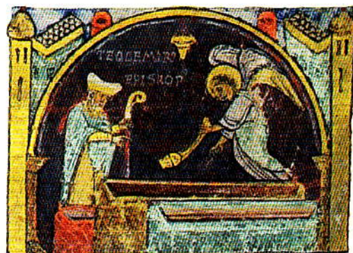
Descubrimiento del Arca - Tumbo A

"Omnes dies et noctes quasi sub una sollemnitate continuato gaudio ad Domini et apostoli decus ibi excoluntur. Valve eiusdem basilice minime clauduntur die noctuque, et nullatenus nox in ea fas est haberi atra (cf. Ap 21, 25), quia candelarum et cereorum splendida luce ut meridies fulget". (Códice Calixtino)